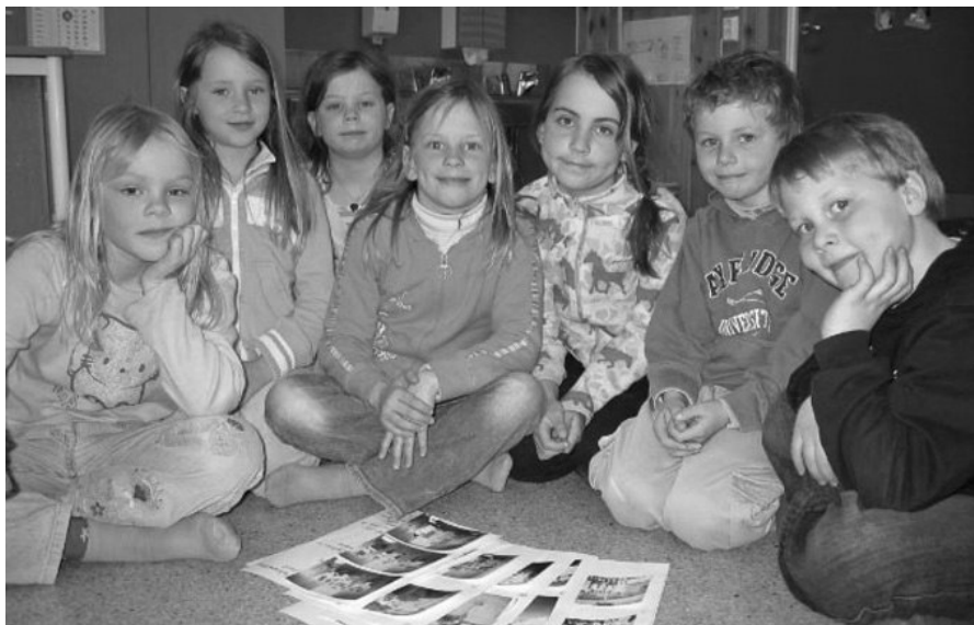
Barn fra Krøderen skole ser på bildene fra Madagaskar.